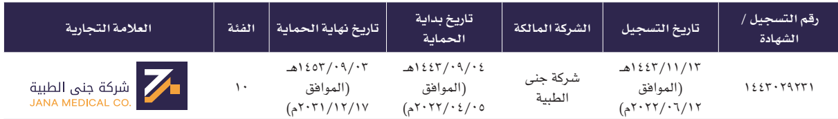
الجدول رقم (٤٠): العلامات التجارية

لدى الشركة شعار عدد (١) تستخدمه في تعاملاتها التجارية وقد تم تسجيله كعلامة تجارية لدى الهيئة السعودية للملكية الفكرية، وقد تم منح العلامة التجارية للشركة الحماية القانونية اللازمة وفقاً لنظام العلامات التجارية، وتعتمد الشركة على هذه العلامة التجارية في نجاح أعمالها ودعم تنافسيتها في السوق، ويبين الجدول التالي التفاصيل المتعلقة بالعلامة التجارية للشركة: